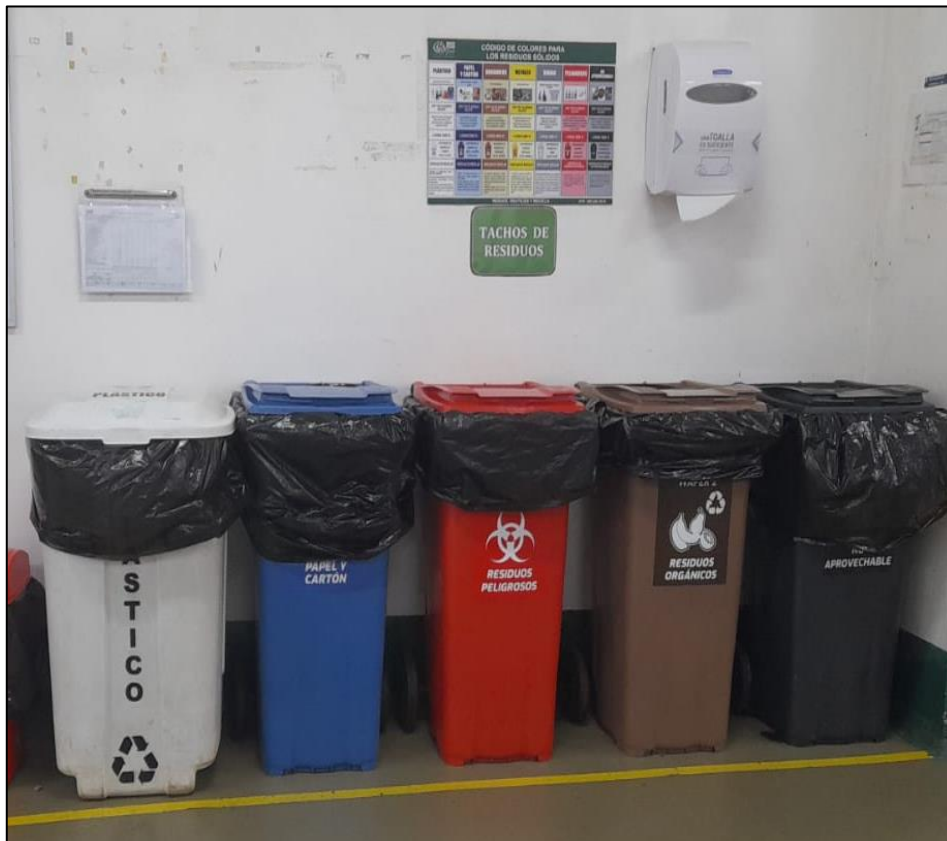
Figura 3. Almacenamiento Primario de Residuos Sólidos

Se cuenta con contenedores para residuos sólidos de diferente capacidad 50, 80, 100 y 120 litros y de diferentes modelos (tapa vaivén, contenedor con pedal, contenedor sin pedal, etc), por lo que se evidencia que los contenedores de residuos sólidos no están estandarizados.