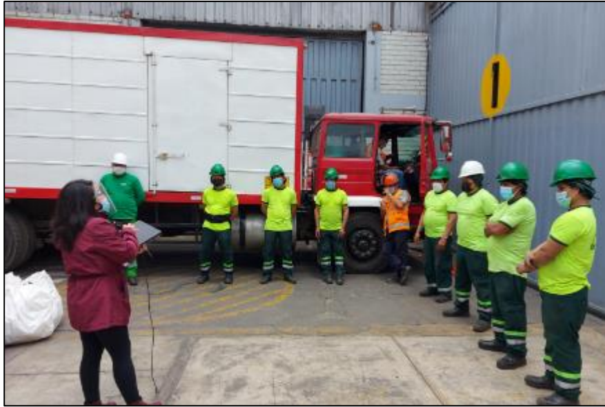
Figura 12. Capacitación de Manejo de Residuos Sólidos dirigido a personal de almacén - Presencial