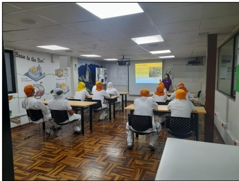
Figura 11. Capacitación de Manejo de Residuos Sólidos dirigido a personal de producción - Presencial

Se realiza charlas preoperacionales respecto a temas ambientales, las cuales tienen una duración de 5 a 10 minutos.