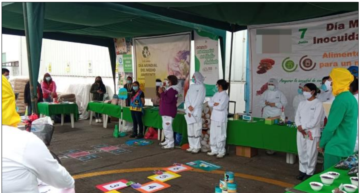
Figura 14. Campaña por el Día Mundial del Medio Ambiente

El equipo de medio ambiente realiza 3 campañas de reciclaje durante el año e invita a los colaboradores a través los canales de comunicación interna a sumarse en las campañas. La participación de los colaboradores consiste en traer residuos generados en sus domicilios como RAEE y papel (Ver figuras 14, 15 y 16), realizar la entrega al equipo de medio ambiente y con ello aumentar la cantidad de residuos que se entregan a ANIQUEM. En caso los colaboradores manifiesten tener RAEE grandes, se realiza la coordinación para poder realizar la recolección en sus domicilios.