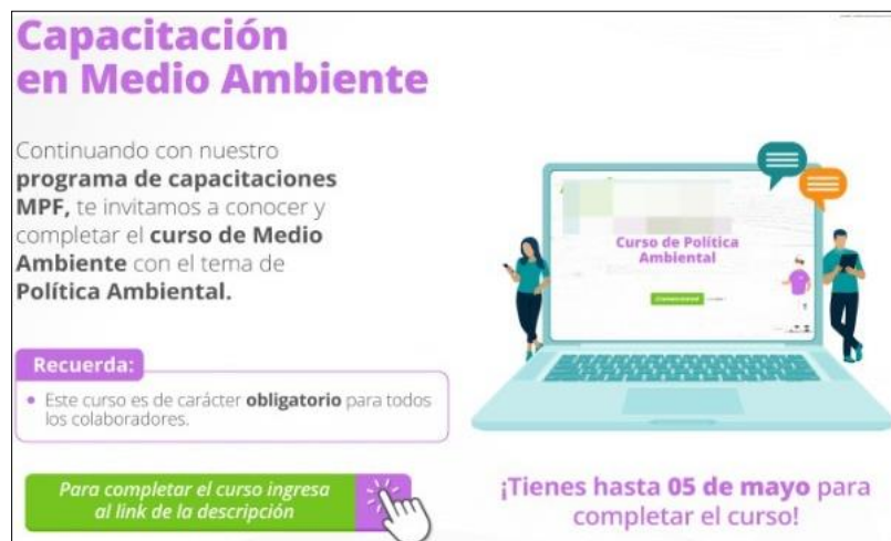
Figura 13. Capacitación de Política Ambiental - Virtual