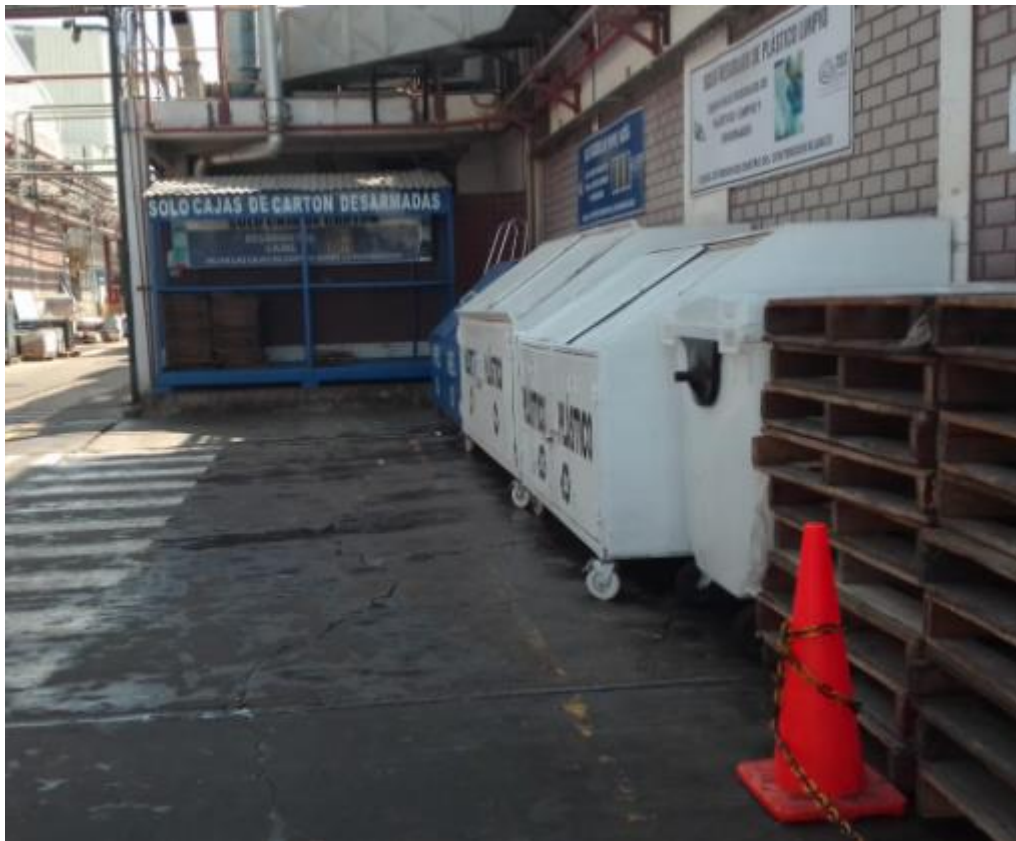
Figura 4. Almacenamiento Intermedio de Residuos Sólidos (contenedor para residuos de plástico, sacos de papel y cartón)