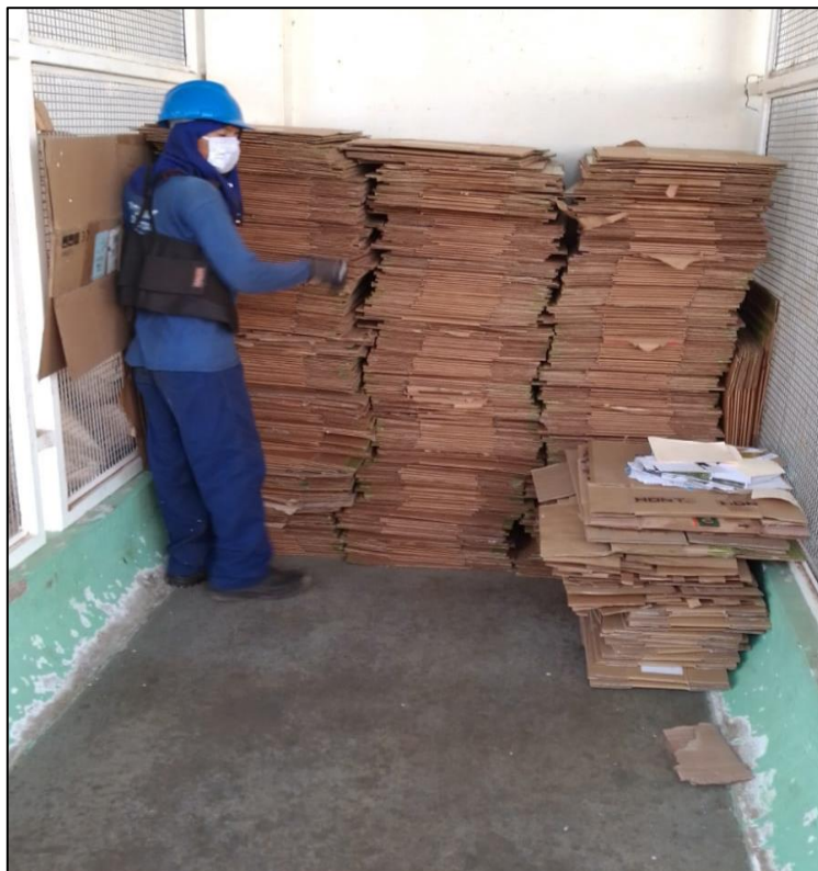
Figura 7. Despacho de Residuos de Cartón