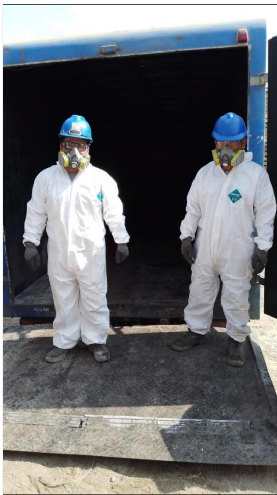
Figura 9. Inicio de la Recolección de Residuos Peligrosos a cargo de la EO-RS