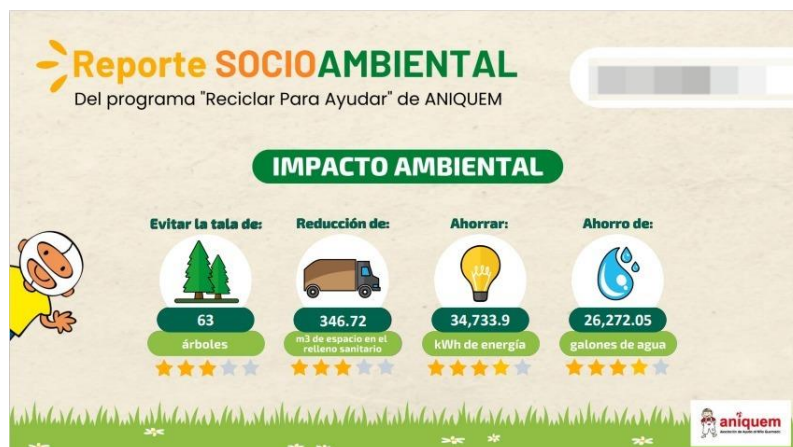
Figura 19. Impacto Ambiental – Convenio ANIQUEM