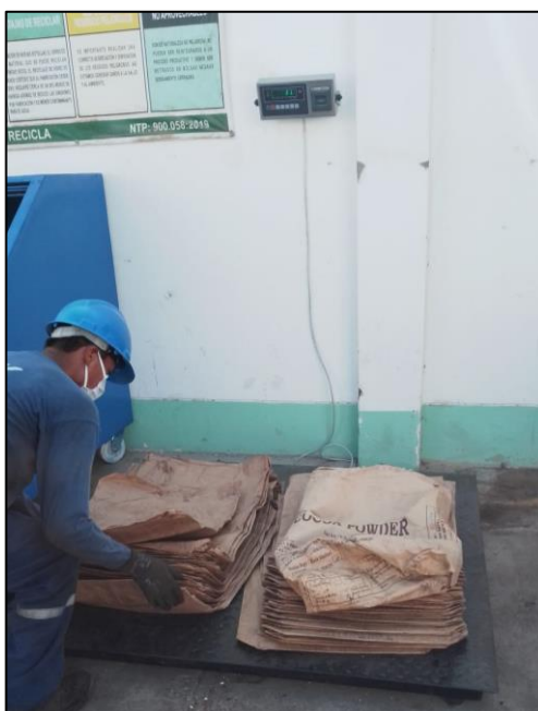
Figura 8. Despacho de Residuos de Sacos de Papel

La frecuencia de recolección de residuos comercializables es de cuatro veces por semana desde el almacén central hacia su planta de operaciones ubicado en la ciudad de ICA y mensualmente la EO-RS emite un certificado de manejo. Para la comercialización, se ha