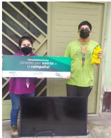
Figura 16. Recolección de RAEE en domicilios

La participación de ABC en el Programa Reciclar para Ayudar ha convertido a la organización en una empresa doble impacto, ya que con ello genera impacto positivo en la sociedad y el medio ambiente.