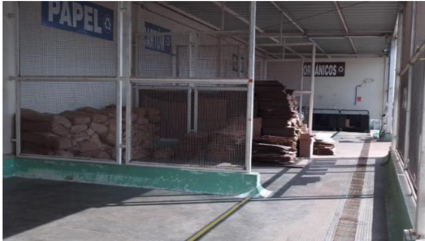
Figura 6. Almacenamiento Central de Residuos Sólidos

La frecuencia del servicio de recolección y transporte de residuos realizado por la empresa operadora se detalla en la siguiente Tabla 8.