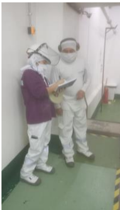
Figura 10. Retroalimentación al personal respecto a la segregación de residuos sólidos