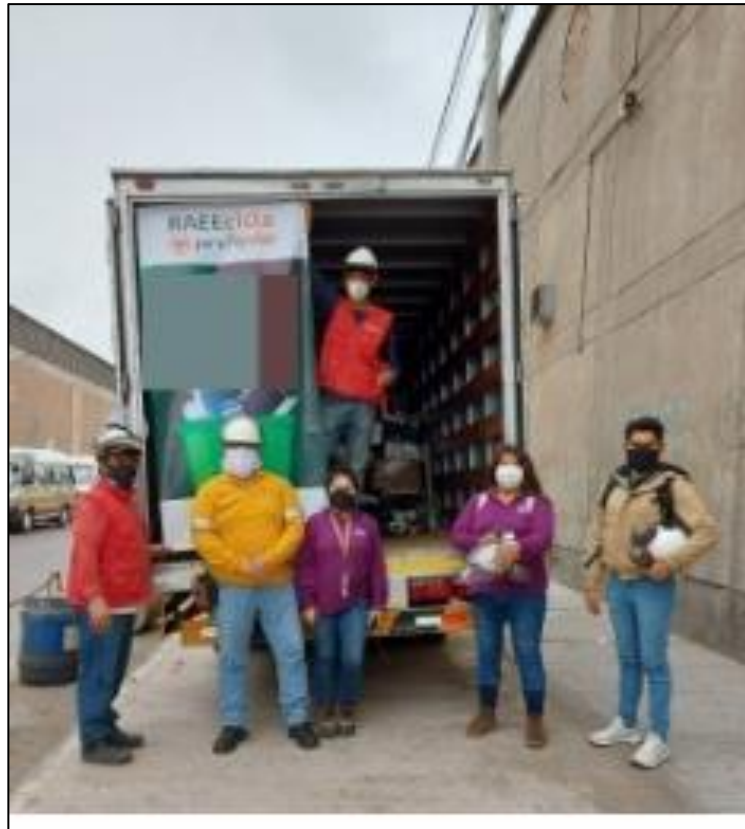
Figura 17. Entrega de RAEE a ANIQUEM