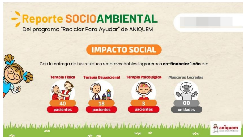
Figura 18. Impacto Social – Convenio ANIQUEM