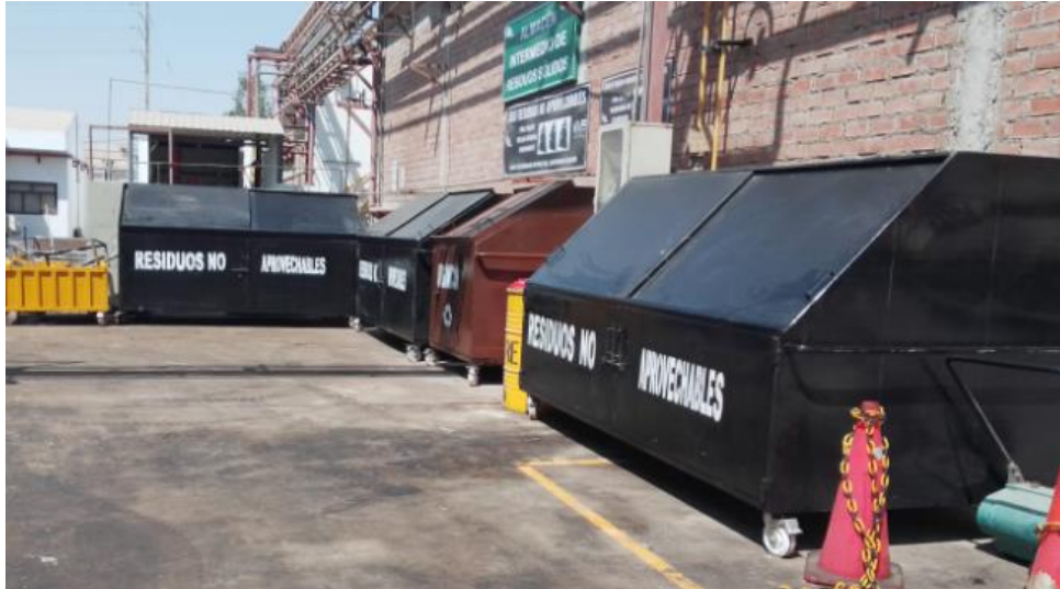
Figura 5. Almacenamiento Intermedio de Residuos Sólidos (contenedor para residuos no aprovechables, orgánicos y metálicos)