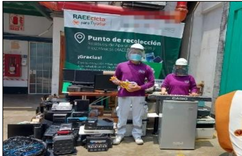
Figura 15. Campaña de Reciclaje de RAEE