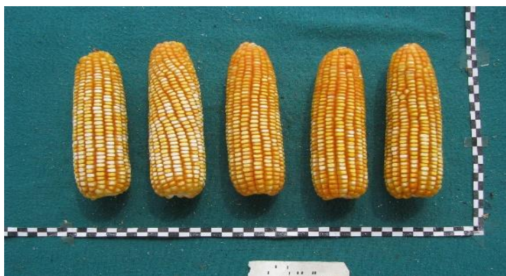
HÍBRIDO 25 X 23