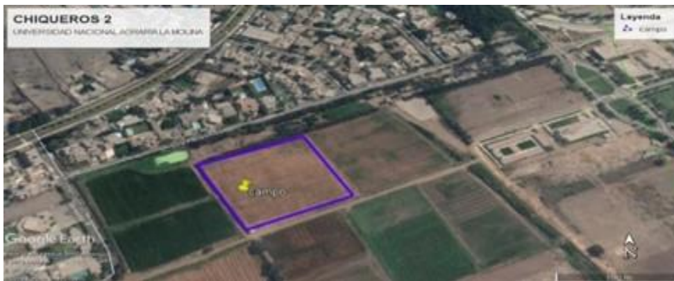
Figura 1: Localización del área experimental “chiqueros 2”, La Molina

El ensayo se realizó en el campo “chiqueros 2” durante el ciclo de primavera – verano del 2018. Se instaló en el campo agrícola experimental del programa de maíz de la Universidad Nacional Agraria La Molina, ubicado geográficamente a 12° 4' 54"S, 76°57'14"O y 251 m.s.n.m.; en el valle de Ate en el distrito de La Molina, provincia de Lima, región Lima de clima subtropical, típico de la costa peruana.